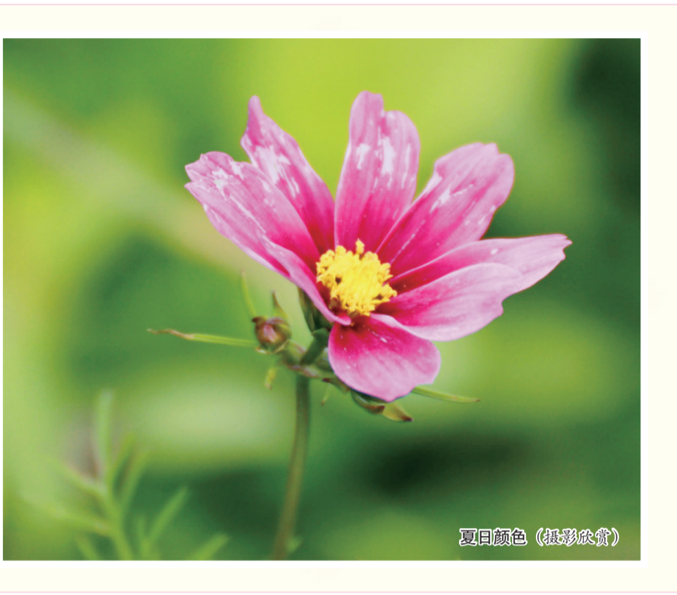
夏日颜色（摄影欣赏）

去梦一次萤火虫吧。或者说，去梦里孵出一只萤火虫吧。小小萤火虫，有自己的光芒。我去捉它，并非要将它据为己有，只是想被它照亮。